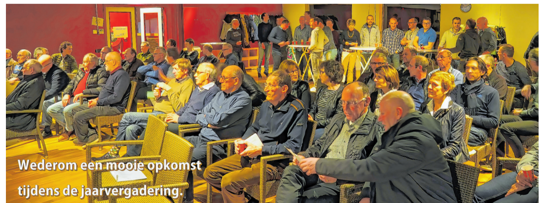
Wederom een mooie opkomst tijdens de jaarvergadering.

Onze vereniging bestaat ruim 50 jaar. Dat had nooit gekund zonder de sponsors van vroeger en nu.